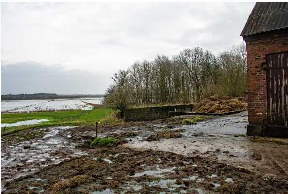
Til venstre: Sneumgaard's enge ned mod Sneum Å er ofte oversvømmet, næsten helt op til gården. I 2019 var det helt galt. Sneum Å længst ude. Til højre: Hjørnet af kostalden med møddingen lige udenfor stalddøren.